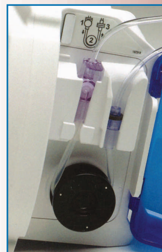
EQUIPO ALIMENTACION de bomba fácil de usar